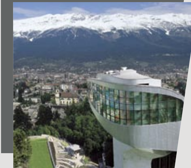
Bergisel-Schanze von Zaha Hadid mit Blick auf Innsbruck und Nordkette

Innsbruck Tourismus | 6021 Innsbruck, Austria Tel.: +43 (0)512 59850 | Email: office@innsbruck.info | www.innsbruck.info Tirol Werbung | Maria-Theresien-Straße 55 | 6010 Innsbruck, Austria Tel.: +43 (0)512 7272 | Email: info@tirol.at | www.tirol.at