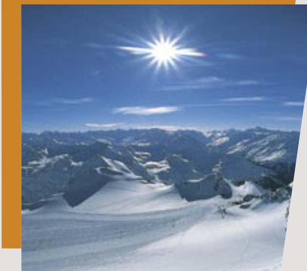
Tirol ist für seine atemberaubende Bergwelt bekannt (Bild: Stubaier Gletscher)