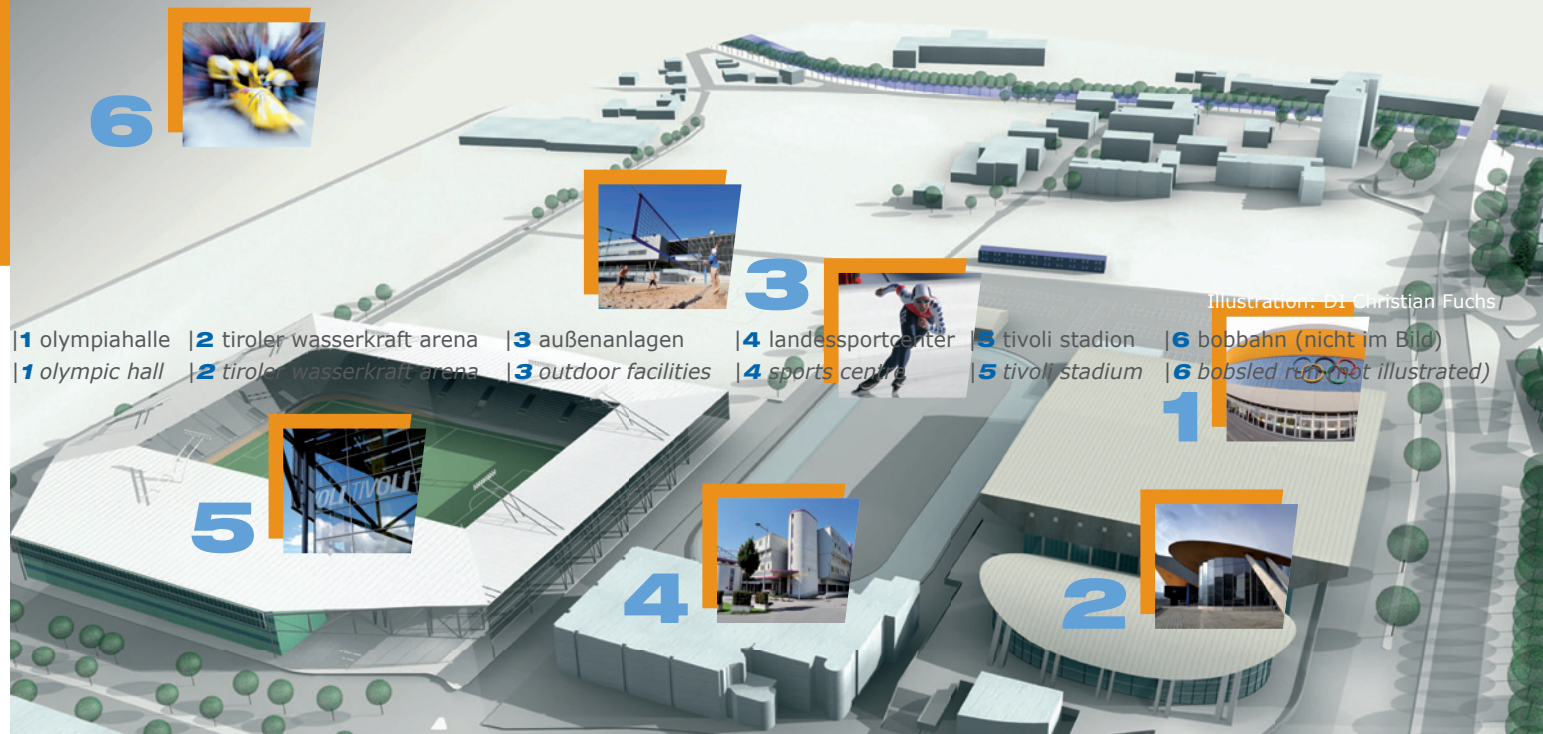
Illustration: DI Christian Fuchs